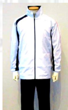
ウインドブレーカー