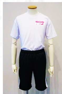
Tシャツ・ハーフパンツ